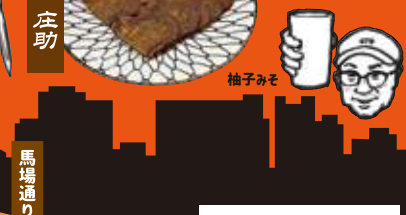
馬場通り ギョウザ