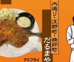
大通り・江野町・曲師町 もつたじ