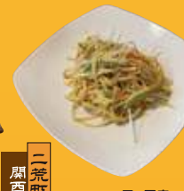
馬場通り 中華料理 満州屋