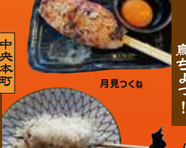
中央本町 つくねバルミジャーノ