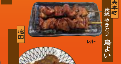
中央本町 炭焼 やきとり 鳥よい