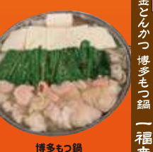
宮園町 博多もつ鍋 一福来