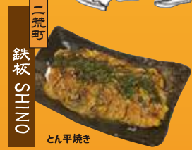
二荒町 鉄板 SHINO とん平焼き