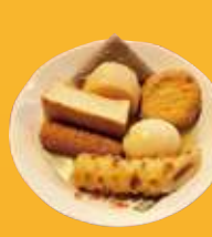
大通り 居酒屋 とり交