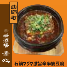
曲師町 中華酒場 幸心