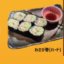
二荒町 天ぶら旬造