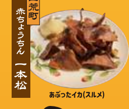
二荒町 赤ちようさん 一本松