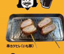
二荒町 串カツ(れいも豚)