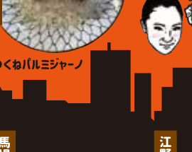
馬場通り ギョウザ