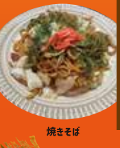
宮園町 坊っちゃん