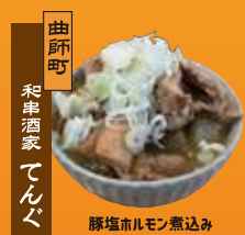
曲師町 和串酒家 てんぐ