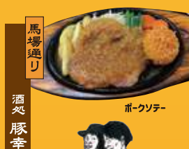
馬場通り 酒処 豚幸