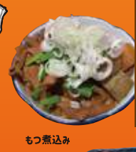
池上町 酒蔵 ふくへ