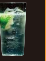
馬場通り ギョウザ