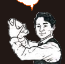
馬場通り バーバークアベニー