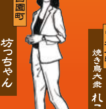
宮園町 焼き鳥大衆 れこべ