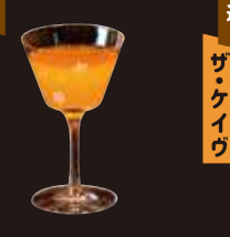
馬場通り ギョウザ