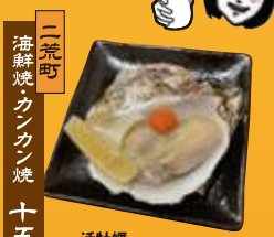
二荒町 海鮮焼カンカン焼 十五