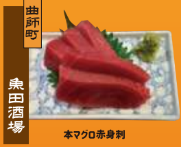
曲師町 本マゴロ赤身刺