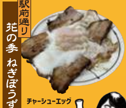
駅前通り 花の季ねぎぼうず