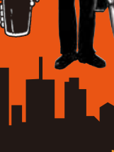
馬場通り ギョウザ