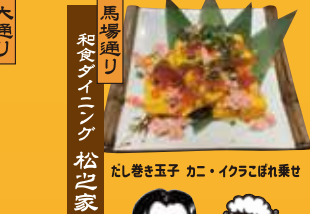
馬場通り 和食ダイニング 松之家