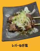
駅前通り やきこん炭善