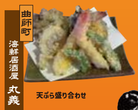
曲師町 海鮮居酒屋 丸義