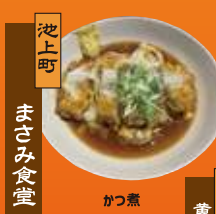
池上町 まさみ食堂