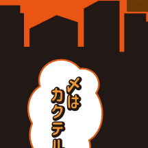
馬場通り カウチル