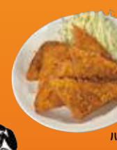
江野町 大衆酒場 出世街道