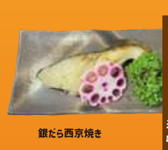
曲師町 旬鮮居酒屋 奈味